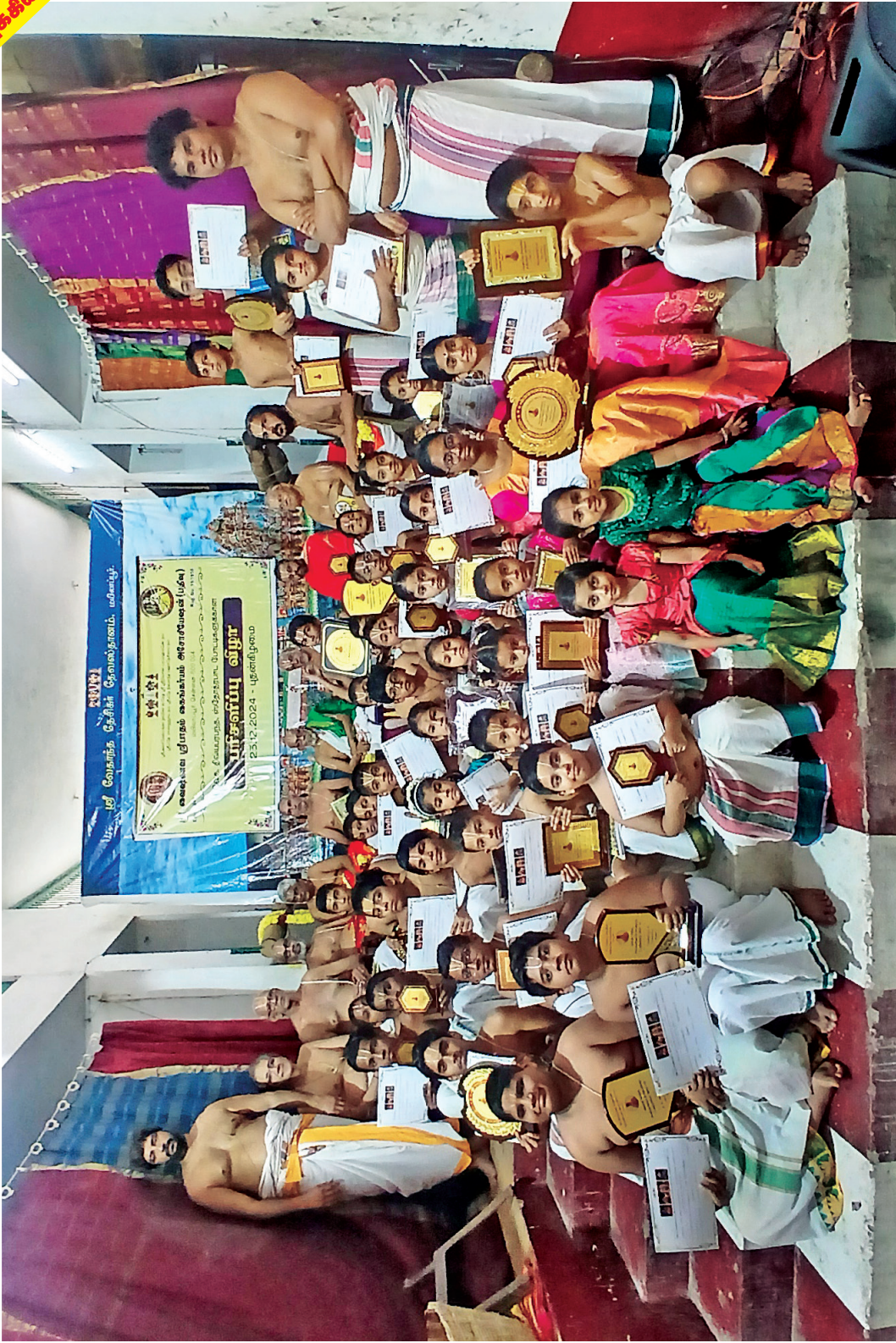
ஸ்ரீவைஷ்ணவ ஸ்ரீபாதம் கைங்கர்யம் அனோஸிவேஷன் பரிசளிப்பு விழா