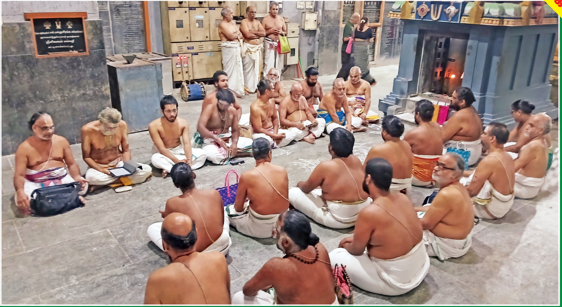
க்ருத்திகா பாராயணம் பூர்த்தி