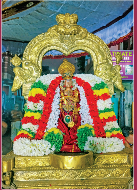
தொண்டரடிப்பொடி ஆழ்வார் திருநகூதரம்