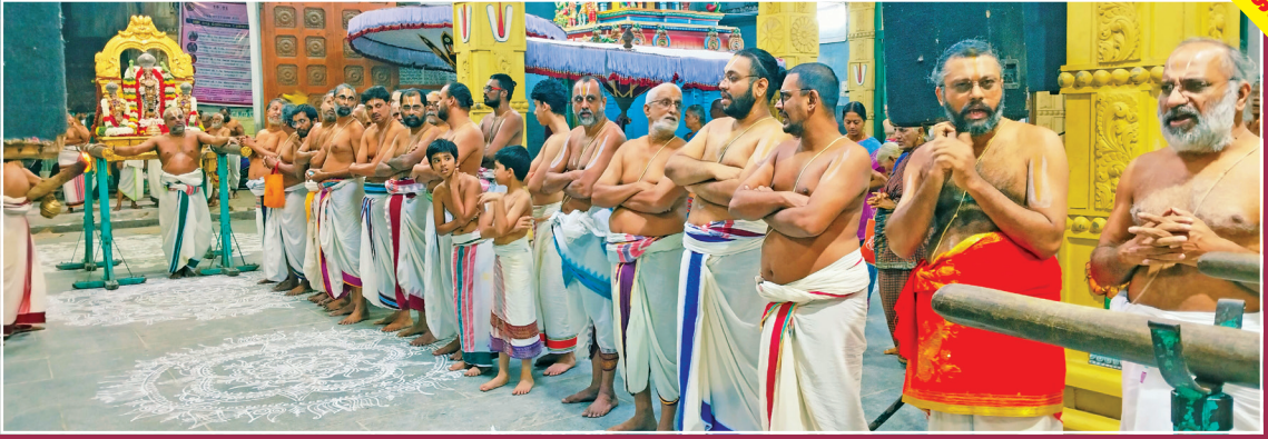
தொண்டரடிப்பொடி ஆழ்வார் திருநகூத்தரம்