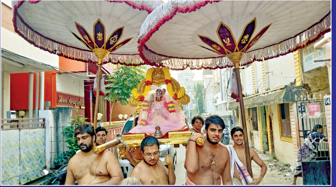
ஆண்டாள் நீராட்ட உத்ஸவம்