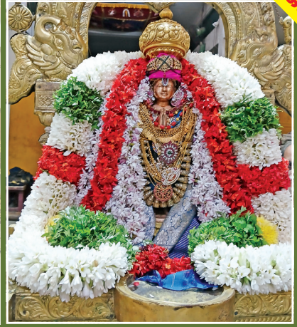
திருப்பாண் ஆழ்வார் திருநகூத்தரம்