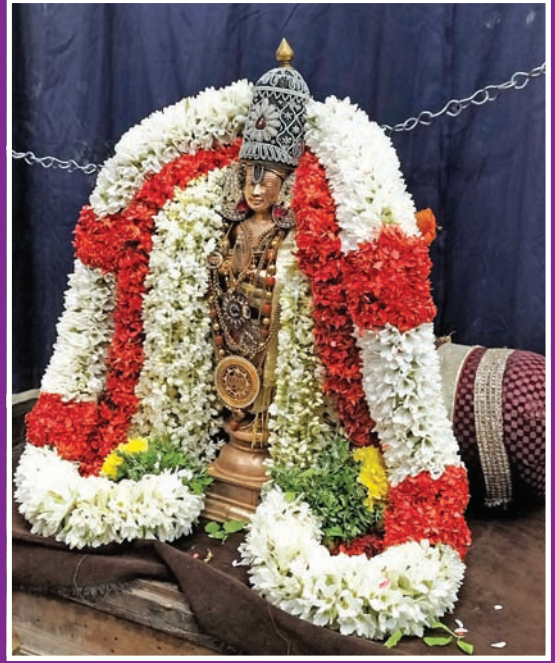
திருப்பாண் ஆழ்வார் திருநகூத்ரம்