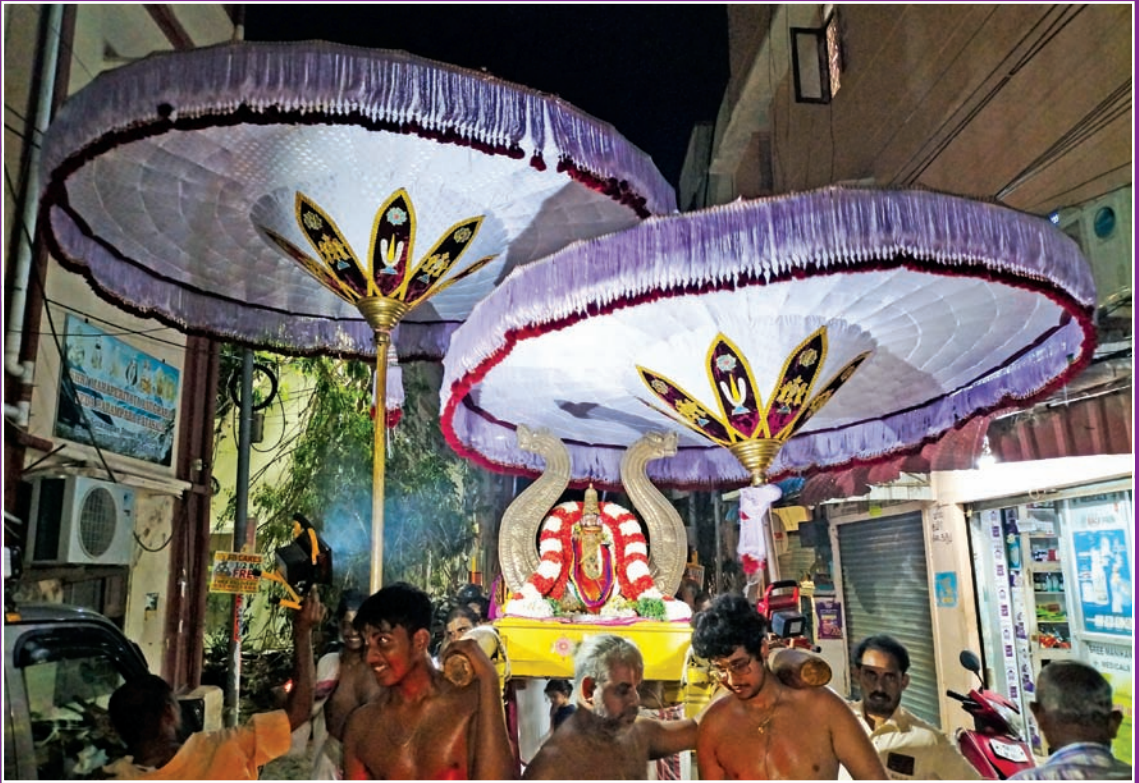
கடை (ஆவணி) சீரவணம்