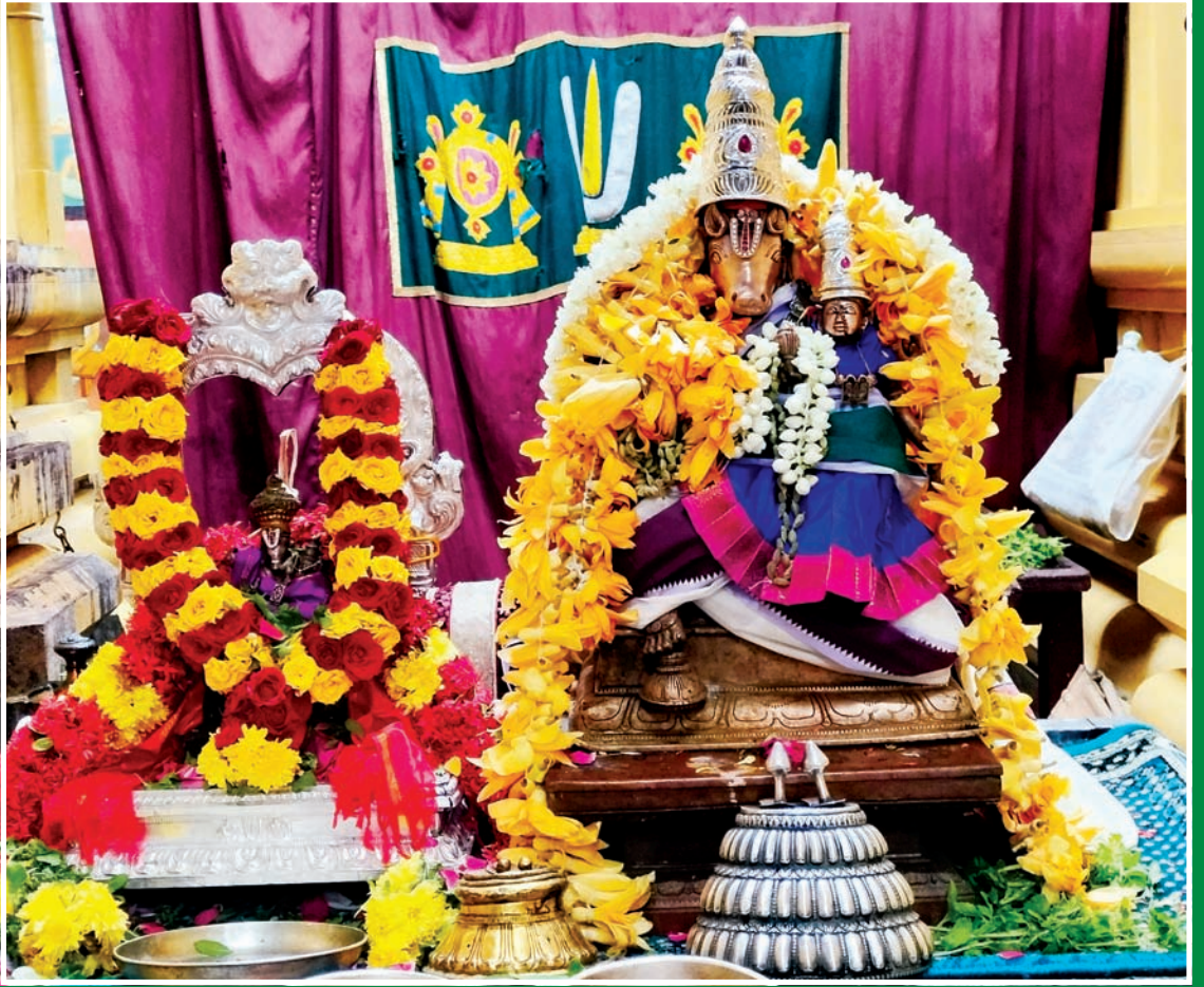
ஸ்ரீ ஹயக்ரிவ ஜயந்தி