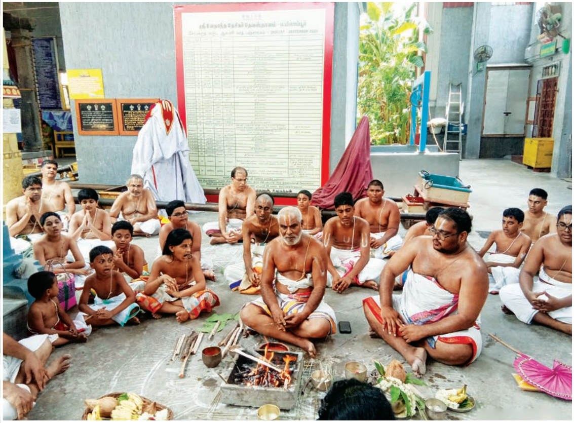
யஜூர் உபாகர்ம் அத்யயன ஹோமம்