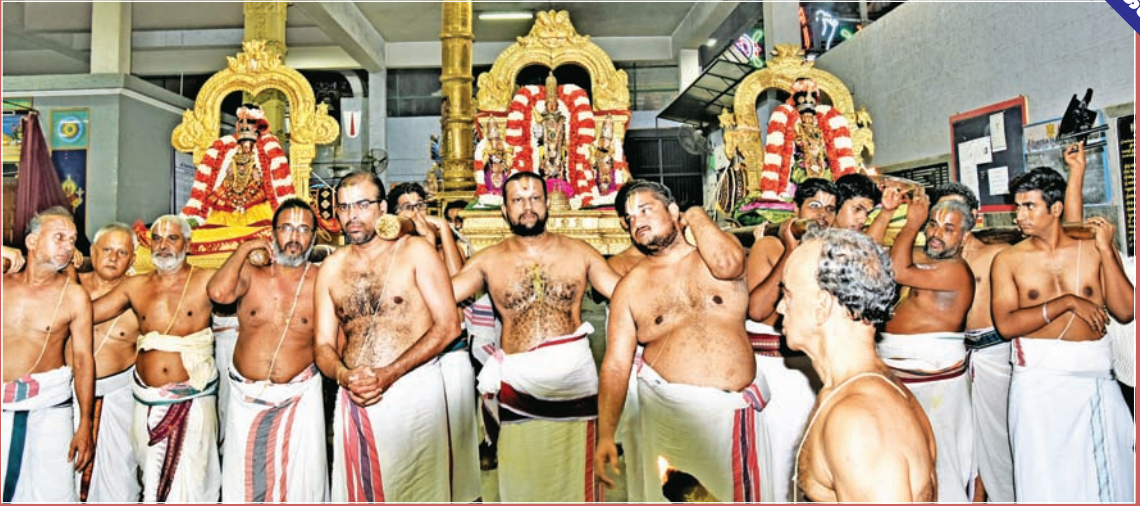
பங்குனி உத்திர ஊர்கோல உத்ஸவம்