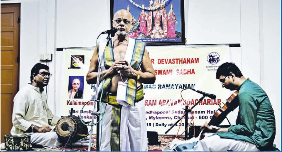
ஸ்ரீமத் ராமாயணம் ஹரிகதா