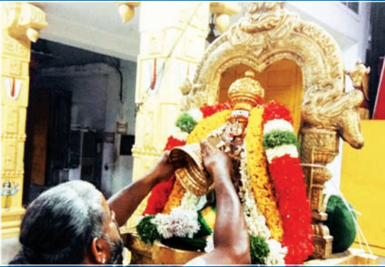
திருக்கச்சி நம்பிகள் திருநஷத்ரம்