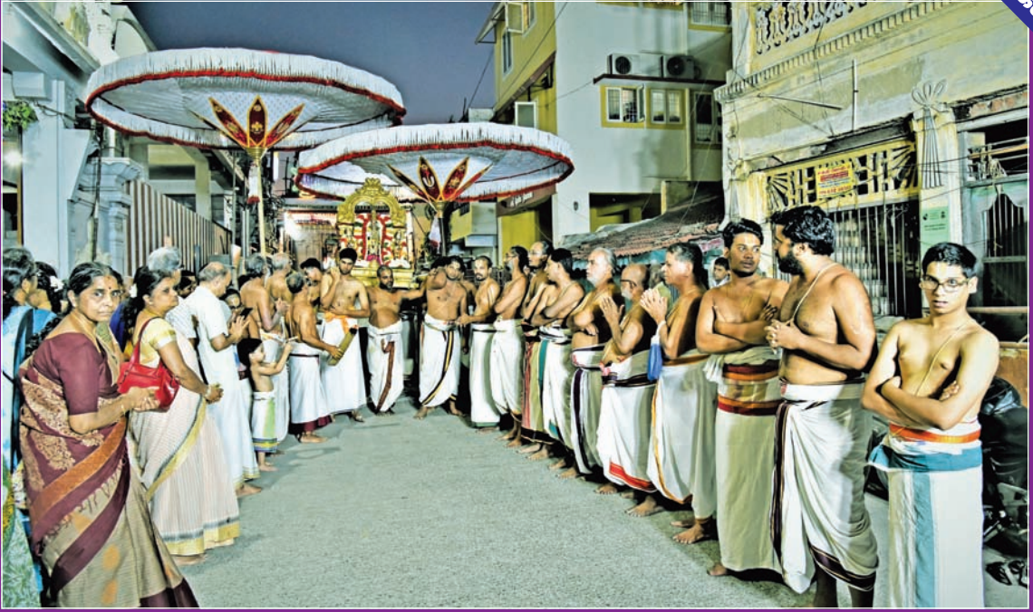
பங்குனி உத்திர உத்ஸவம்