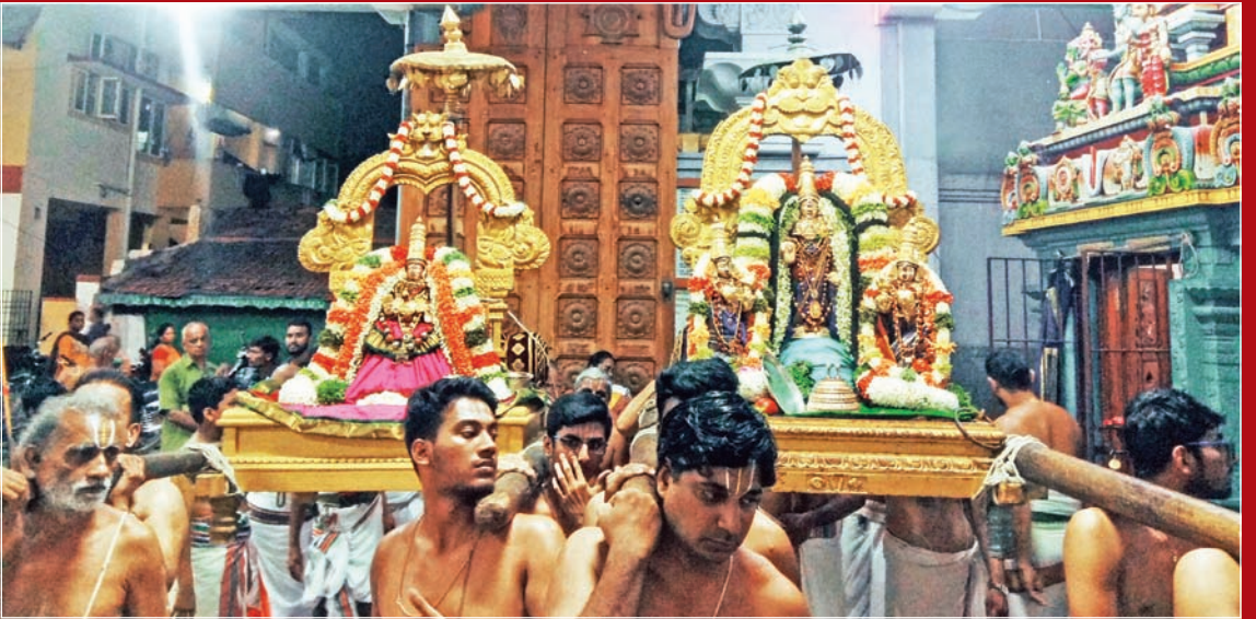
பங்குனி மாதப்பிறப்பு புறப்பாடு