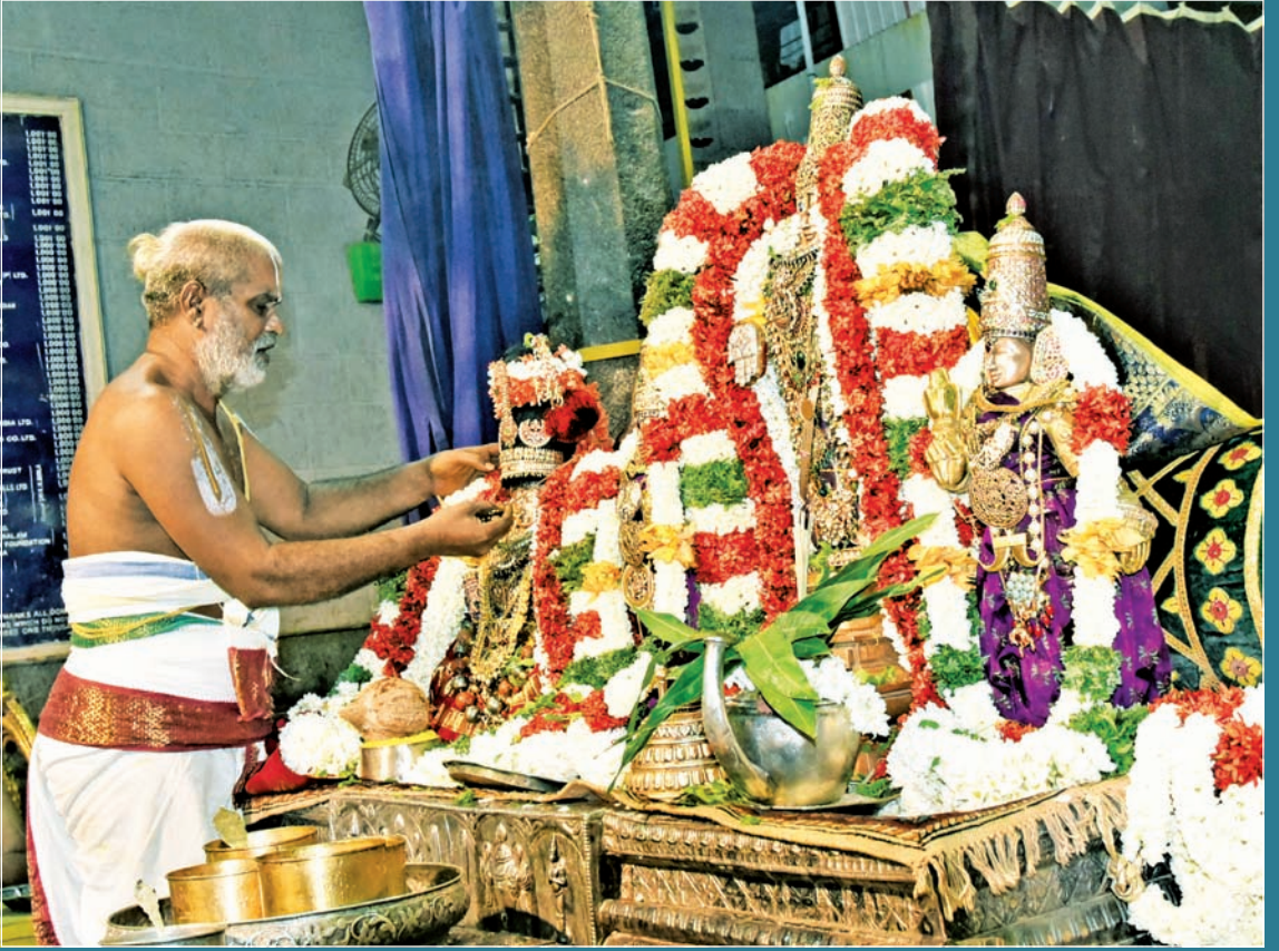
பங்குனி உத்திர உத்ஸவம்