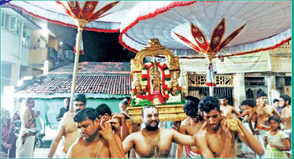
யுகாதி வருஷப்பிறப்பு உத்ஸவம்