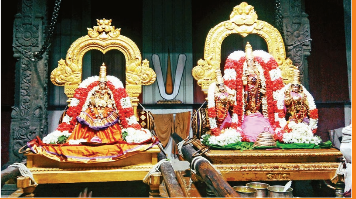
அமாவாசை, வெள்ளிக்கிழமை புறப்பாடு