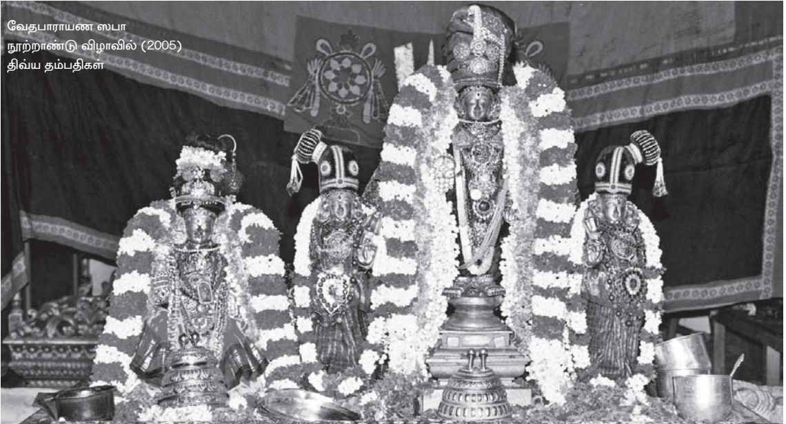
வேதபாராயண ஸபா நூற்றாண்டு விழாவில் (2005) திவ்ய தம்பதிகள்

கடந்த 1905ஆம் ஆண்டு வேதபாராயண ஸபா அந்தநாளில் மாடமாமயிலையில் எழுந்தருளியிருந்த பல மஹான்களால் தொடங்கப்பட்டது. நம் ஸந்நிதியில் எம்பெருமான் எழுந்தருள்வதற்கு முன்பாகவே இந்த வேதபாராயண ஸபை